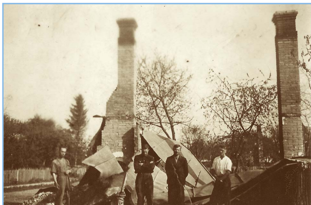
Malín po tragedii 13. 7. 1943

Nemohoucí pacienti místní nemocnice byli zastřeleni přímo na postelích, skrývající se civilisté byli zavražděni ve svých útočištích. V Ukrajinském Malíně byly ženy a děti odděleny od mužů, ponechány v zamčených domech a zaživa upáleny. Několik mužů bylo pověřeno odvézt naložené povozy z Ukrajinského Malína, zatímco ostatní nacisté zamkli v pravoslavném kostele a škole, které zapálili. Všechny oběti, včetně dětí, byly označovány za "bandity", tedy členy nelegálních vojenských uskupení. Nacisté tak maskovali zvůli a sprostou vraždu nevinných vesničanů. Do posledních okamžiků života obyvatel jim nikdo z útočníků neřekl, proč k této brutální akci došlo.