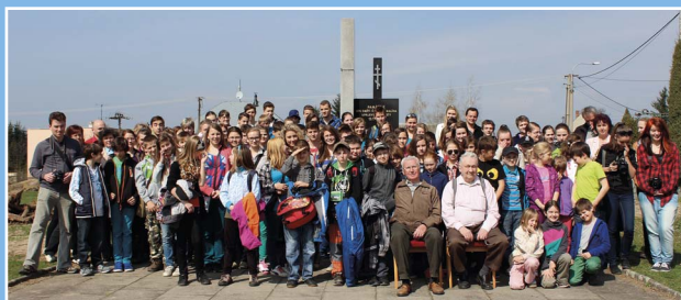
Děti s pamětníky před památníkem obětí v Novém Malíně, r. 2014