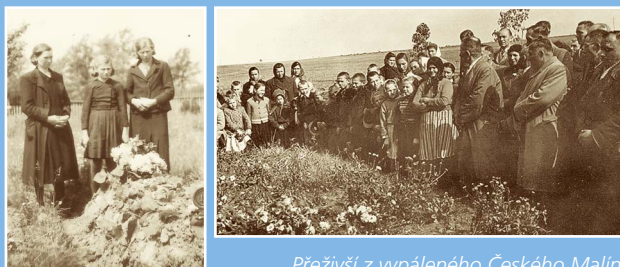
Přeživší z vypáleného Českého Malína