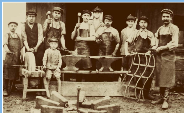
Před kovárnou v Kechrta

české školy, ochotnický soubor, knihovna, hospoda se společenským sálem a sbor dobrovolných hasičů.