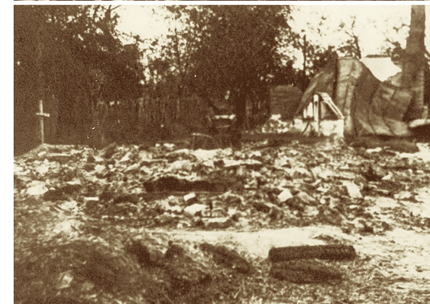
Malín po tragedii 13. 7. 1943