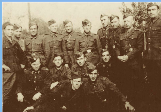
Českoslovenští vojáci po osvobození Českého Malína

V době první světové války prošla fronta i Českým Malínem. Na počátku října 1915 se z oblasti stáhla ruská armáda, aby ji vystřídala vojska rakouská, resp. české pluky. Během tří let bojů vesnice utrpěla značné škody, ale po válce se v ní opět naplno rozhořel nový život. Český Malín nyní patřil k Polsku a o jeho rozvoj se do značné míry postaralo československé vyslanectví ve Varšavě. Když v září 1939 zaútočily nacistické a sovětské armády na Polsko a okupovaly jej, připadl