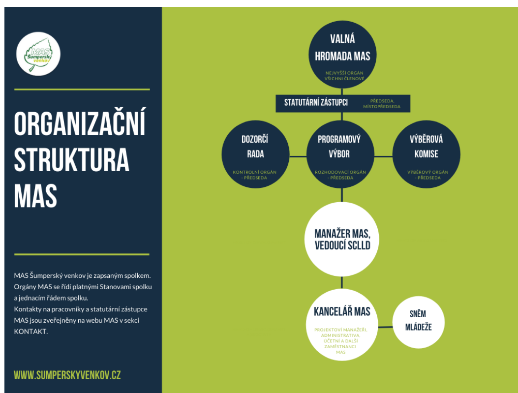
Obrázek 4 Organizační struktura MAS Šumperský venkov