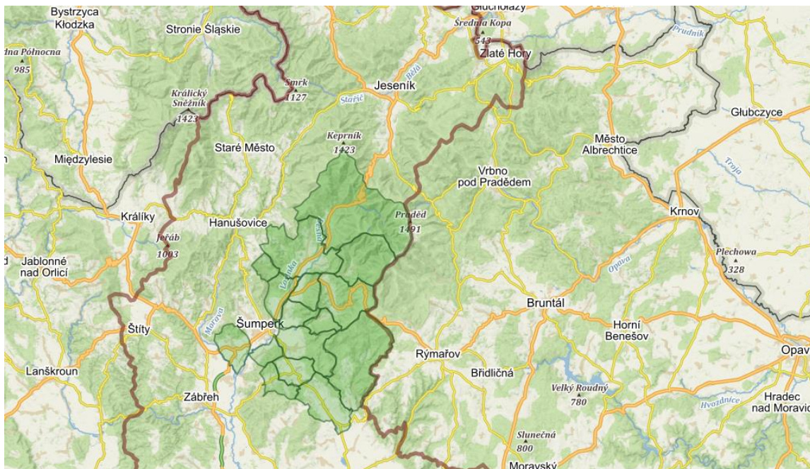
Obrázek 2 Území působnosti MAS Šumperský venkov s vyznačením hranic obcí