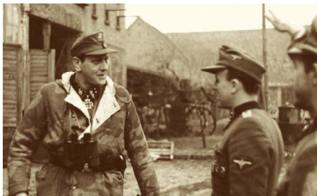
Otto Skorzeny hat im Februar 1945 die Rückzugoperationen der nazistischen Armee befehligt

Am Ende des Jahres 1965 hat die Tschechoslowakische Regierungskommission für die Verfolgung von nazistischen Kriegsverbrechern in die BRD und DDR eine Gedächtnisschrift geschickt, wo die konkreten Schuldigen der Verbrechen in Ploština, Prlov und Vařákovy paseky angegeben wurden. Neben Otto Skorzeny wurden an der Liste sieben andere Täter angegeben. O.Skorzeny wurde von wienerischen Ermittlern untersucht, aber vor dem Gericht hat er nie gestanden, weil er seit dem Jahr 1949 in dem faschistischen Spanien gelebt hat. In dem Jahre 1970 hat man festgestellt, dass nur Robert Holzheuer lebt, also der, der zu den Partisanen in Ploština beide Vertrauten Baťa und Machů geschickt hat, und er war selbst in allen Vernichtungsaktionen tätig. Nach den tschechoslowakischen Ermittlern hatte man keinen Zweifel, dass er schuldig ist, nach der deutschen Polizei waren die Beweise ungenügend und die Untersuchung wurde im September 1971 als gegenstandslos angehalten.