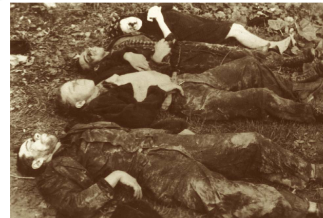
Vier Einwohner von Vařákovy paseky wurden am 3. Mai 1945 zu Tode gefoltert