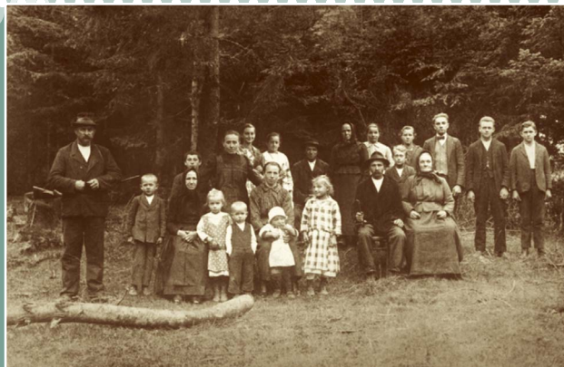
Einwohner von Vařákovy paseky im Jahre 1927

Vysoké Pole, Pozdřechov, Lačnov, Bratřejov hinter sich gelassen, woher andere Opfer gekommen sind.