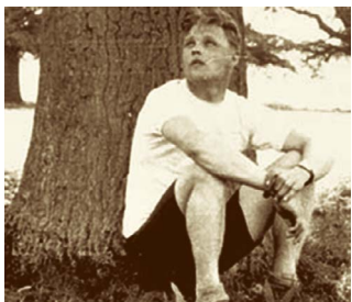
Josef Valčík na snímku ve Smolině nebo Zlíně

Veledůležitá vysílačka našla svůj úkryt v Ležákách na Českomoravské vysočině a fungovala zde až do poloviny června 1942. Josef Valčík svoji rodinu krátce po přiletu vyhledal a navštěvoval ji. Účastnil se příprav a provedení atentátu na Reinharda Heydricha. Padl hrdinnou smrtí 18. června 1942 v kostele sv. Cyrila a Metoděje společně se šesti kamarády. Čtrnáct členů Valčíkovy rodiny bylo zatčeno a popraveno.