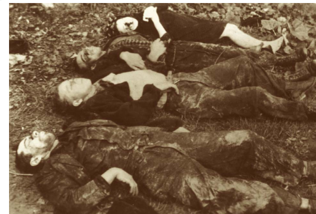
Čtyři obyvatelé Vařákových pasek umučení 3. května 1945