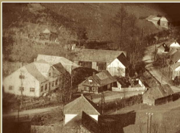
V prlovské hospodě byly oběti drženy, než začalo jejich vraždění v jednotlivých domech, r. 1945 (Pamětní síň Prlov)