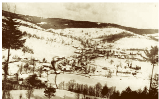
Malebná obec Prlov v zimě 1944-45