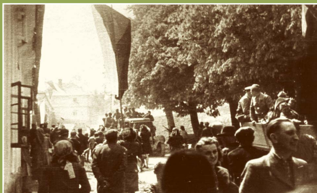
Dny osvobození Rudou armádou (Vlastivědné muzeum v Olomouci)