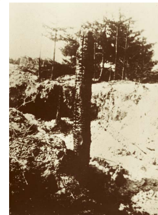
Zbytky shořelé lesní boudy u Kyjanice