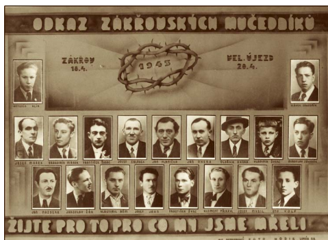
Oběti zákřovského masakru