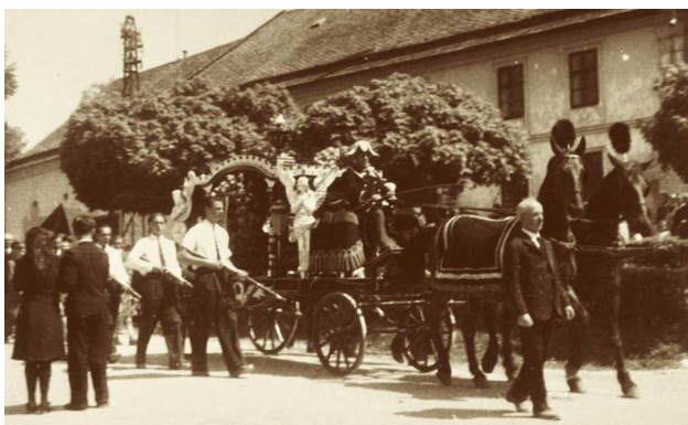
Smuteční průvod při posledním rozloučení s oběťmi masakru (Vlastivědné muzeum v Olomouci)