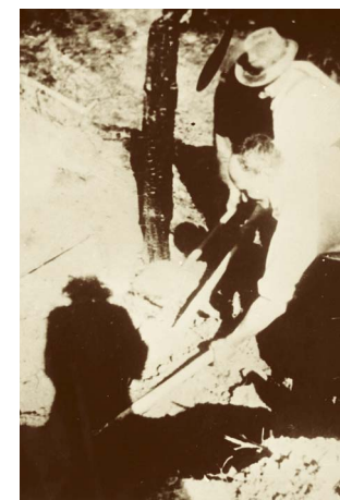
Exhumace pozůstatků obětí

byli propuštěni muži nad padesát let věku, zatímco zbývajících 23 mužů bylo převedeno do služebny gestapa ve Velkém Újezdě, kde je zavřeli v chlévě na dvoře radnice. Dva dny museli zajatci snášet kruté výslechy doprovázené surovým zacházením. 4 muži byli propuštěni, ale zbývajících 19 bylo