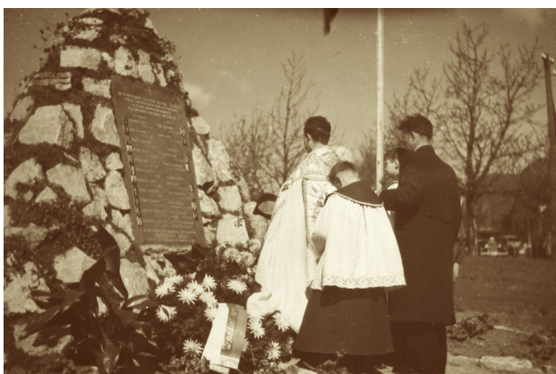
Bohoslužba u původního památníku